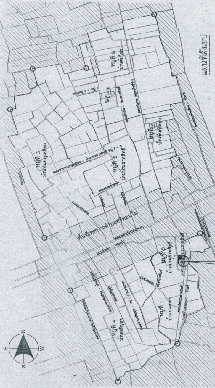
แผนผังที่ดิน